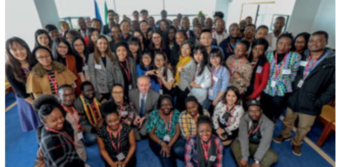
An tAire Stáit ar a bhfuil freagracht ar leith as an Diaspóra agus Forbairt Idirnáisiúnta, Ciarán Cannon, T.D., le Comhaltáí 2018-19 Chúnamh Éireann i Luimneach. Aibreán 2019.

D'fhonn luach na trádála dhá bhealach a mhéadú idir Éire agus an Afraic go dtí €5 bhilliún ar a laghad faoi 2025 agus chun infheistíocht a chur chun cinn, déanfaimid an méid seo a leanas: