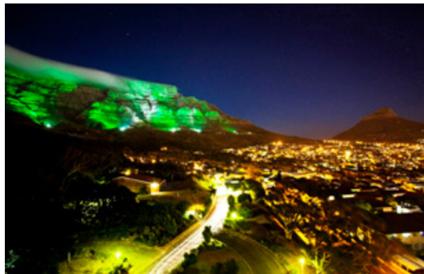
Tá Crann Síoda Cadáis Freetown, Eas Victoria, Pírimid Mhór Giza agus Hoerikwaggo Cape Town ar roinnt de chomharthaí talún na hAfraice ar cuireadh dath glas orthu chun Lá Fhéile Pádraig a cheiliúradh.