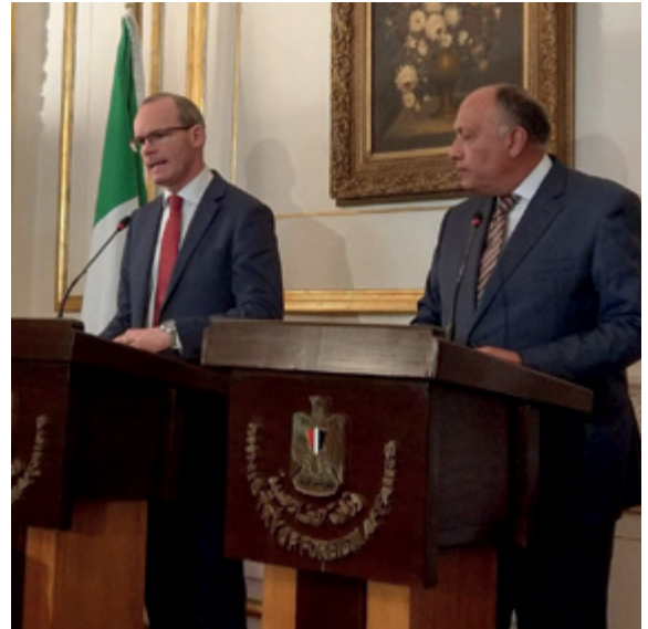
An Tánaiste agus an tAire Gnóthaí Eachtracha agus Trádála, Simon Coveney, T.D., agus Aire Gnóthaí Eachtracha na hÉigipte, Sameh Shoukry, i gCaireo. Eanáir 2018.