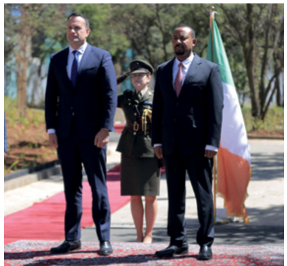
An Taoiseach Leo Varadkar, T.D., le Príomh-Aire na hAetóipe agus Buaiteoir Dhuais Nobel na Síochána 2019, A Shoilse Abiy Ahmed, in Ádis Ábeba, an Aetóip. Eanáir 2019.