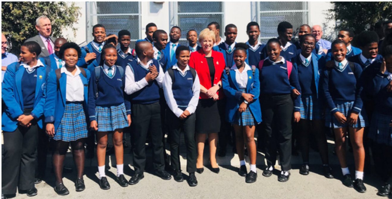
An tAire Gnó, Fiontar agus Nuálaíochta, Heather Humphreys, T.D., ar cuairt ar scoil eolaíochta, teicneolaíochta, innealtóireachta agus matamaitice a fhaigheann tacaíocht ó eagraíocht Éireannach, International Computer Driving Licence (ICDL), le linn misean trádála chuig an Afraic Theas. Samhain 2019.