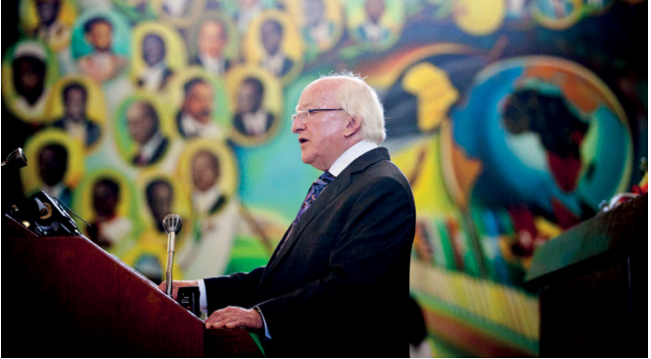
An tUachtarán Micheál D. Ó hUigínín ag tabhairt aithisc do Choimisiún Eacnamaíoch na Náisiún Aontaithe don Afraic, Ādis Ābeba, an Aetóip. Samhain 2014.