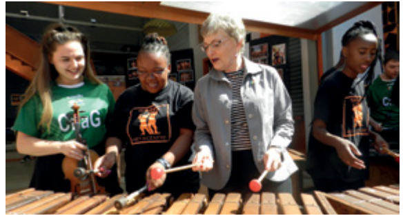
An tAire Leanaí agus Gnóthaí Óige, Katherine Zappone, T.D., le ceoltóirí ón Afraic Theas agus ó Éirinn, ar cuairt ar Ealaíona Pobail Sibikwa in Johannesburg chun Lá Fhéile Pádraig a cheiliúradh le ceol cumaisc na hAfraice Theas/na hÉireann. Márta 2019.