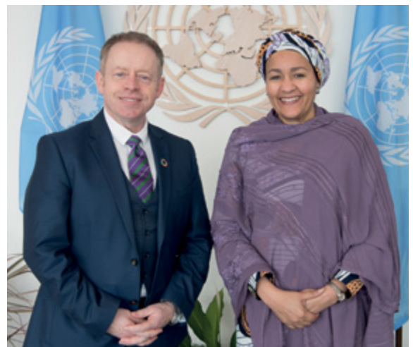
An tAire Stáit ar a bhfuil freagracht ar leith as an Diaspóra agus Forbairt Idirnáisiúnta, Ciarán Cannon, T.D., le Leas-Ard-Rúnaí na Náisiúin Aontaithe, Amina Mohammed. Feabhra 2018.