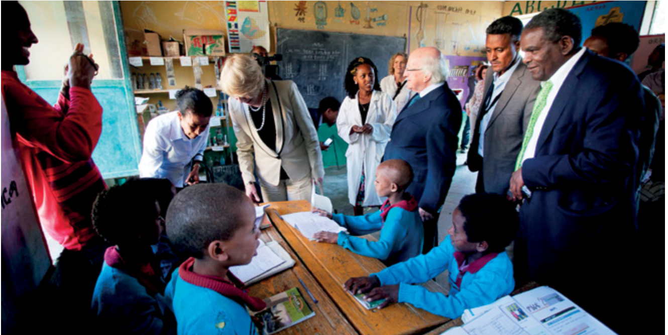
An tUachtarán Micheál D. Ó hUiginn agus a Bhean Sabina Higgins ar cuairt ar sheomra ranga in Damayno, Tigray, an Aetóip. Samhain 2014.