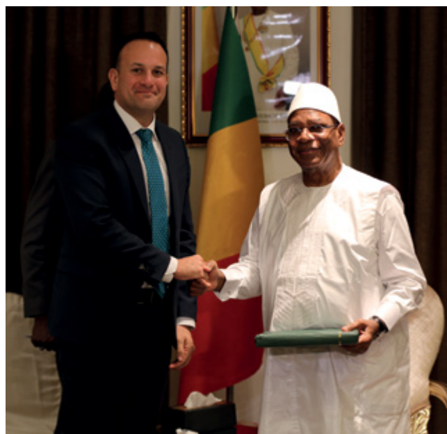
An Taoiseach Leo Varadkar, T.D., ag bualadh le hUachtarán Mhailí, A Shoilse Ibrahim Boubacar Keita, in Bamako, Mailí. Eanáir 2019.

Tacaíonn Éire go láidir le cur chuige an Aontais Eorpaigh i leith na hAfraice a bheadh i bhfad níos uaimhianá. Chuige sin is gá go mbeadh Éire an-eolach, go háirithe trí rannpháirtíocht fheabhsaithe le tíortha na hAfraice ionas gur féidir le hÉirinn abhcóideacht a dhéanamh laistigh den Aontas Eorpach maidir le ceisteanna atá chun a leasa – mar an tír is mó a labhraíonn Béarla atá fós san Aontas Eorpach go háirithe.