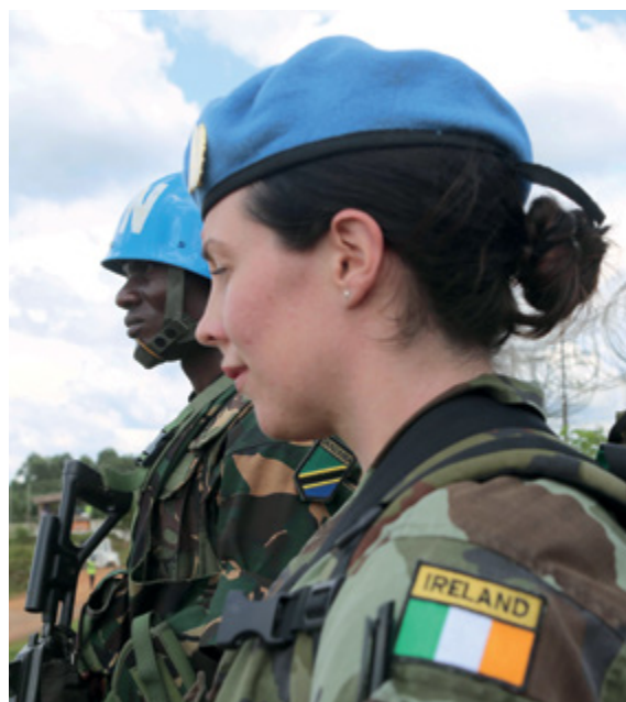
Tá MONUSCO i bPoblacht Dhaonlathach an Chongó ar cheann den líon mór de mhísin síochánaíochta ina raibh coimeádaithe síochána na hÉireann agus na hAfraice ag obair le chéile le haghaidh síochána agus cobhsaíochta.